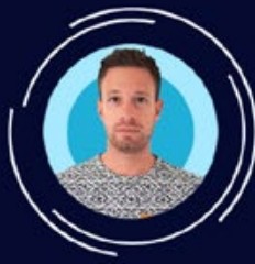
Benoit Rayon Communication