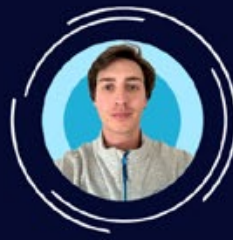
Mathieu Cabar Communication