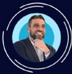
Arnaud Bidou Communication