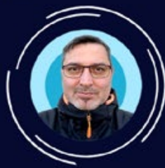
Stéphane Durand-Robin Communication